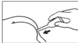
2. Tüpün ağız kısmını makata tamamen sokun (Yeni doğanlarda ve çok küçük bebeklerde 15 kg'ın altındaki, yarısı sokulur). Rektal tüpü ucundan aşağıya doğru tutun. Tüpü baş ve işaret parmaklarıyla sıkarak içeriğini tamamen boşaltın.