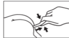
3. Tüpü makattan çıkartırken, çözeltinin tüpe geri emilimini önlemek için tüpü sıkmaya devam edin. Daha sonra hastanın kalçalarını bir müddet sıkın. Doz verildikten sonra tüpte az miktarda çözelti bırakılması amaçlanmıştır