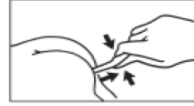
3. Tüpü makattan çıkartırken, çözeltinin tüpe geri emilimini önlemek için tüpü sıkmaya devam edin. Daha sonra hastanın kalçalarını bir müddet sıkın. Doz verildikten sonra tüpte az miktarda çözelti bırakılması amaçlanmıştır