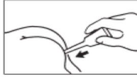
2. Tüpün ağız kısmını makata tamamen sokun (Yeni doğanlarda ve çok küçük bebeklerde 15 kg'ın altındaki, yarısı sokulur). Rektal tüpü ucundan aşağıya doğru tutun. Tüpü baş ve işaret parmaklarıyla sıkarak içeriğini tamamen boşaltın.