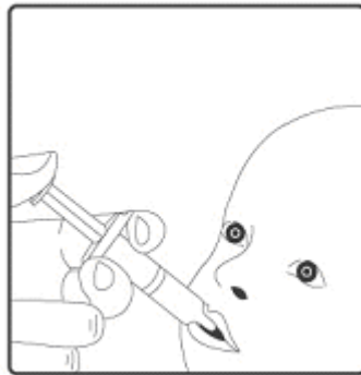
2. Bu aşı sadece oral uygulama içindir. Çocuk yaslanma pozisyonunda oturtulmalı ve oral aplikatörün tüm içeriği yanağın iç tarafına oral yolla uygulanmalıdır.