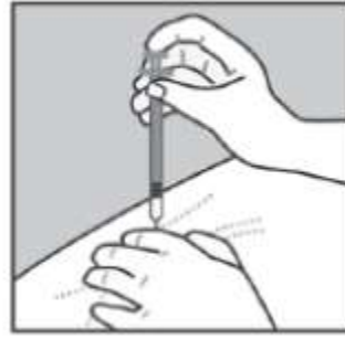
Şekil – 3

Yetiřkinlerde önerilen doz 20 mg glatiramer asetatın (bir adet kullanıma hazır dolu enjektör) günde bir defa deri altına enjeksiyonudur.